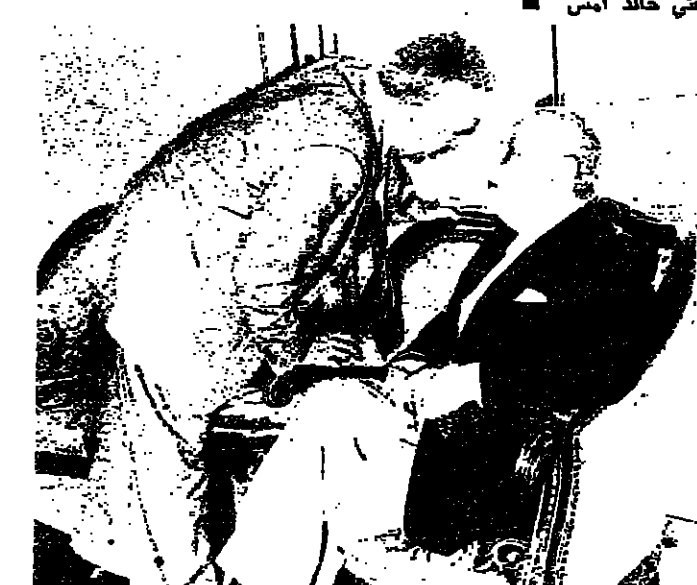
حدث بين الرئيسين سلام وكرامي في منزل سماحة المفتي خالد بعد ظهر امس

وجنابا الرئيس فرنجة قد استقبل السيد كمال جنبلاط في الساعة الخامسة والنصف حتى السادسة، ولقد خرجوه من القصر القتي الرئيس سلام